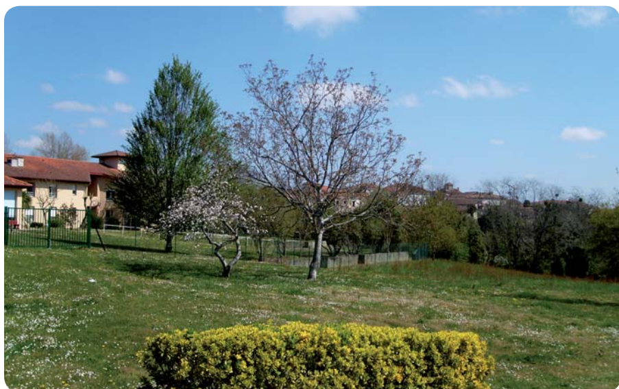
Le pôle petite enfance sera implanté à côté de la maison de retraite de Montfort-en-Chalosse.

durable appliquée aux bâtiments permet de vivre et de travailler dans des locaux plus confortables, plus économiques et plus respectueux de l'environnement et de la santé de leurs occupants. Elle présente de nombreux avantages en termes de qualité de vie, de santé, d'environnement, mais également des avantages économiques. Le coût global de fonctionnement de ce bâtiment bien isolé, bien orienté, sera moins élevé que pour les constructions traditionnelles.