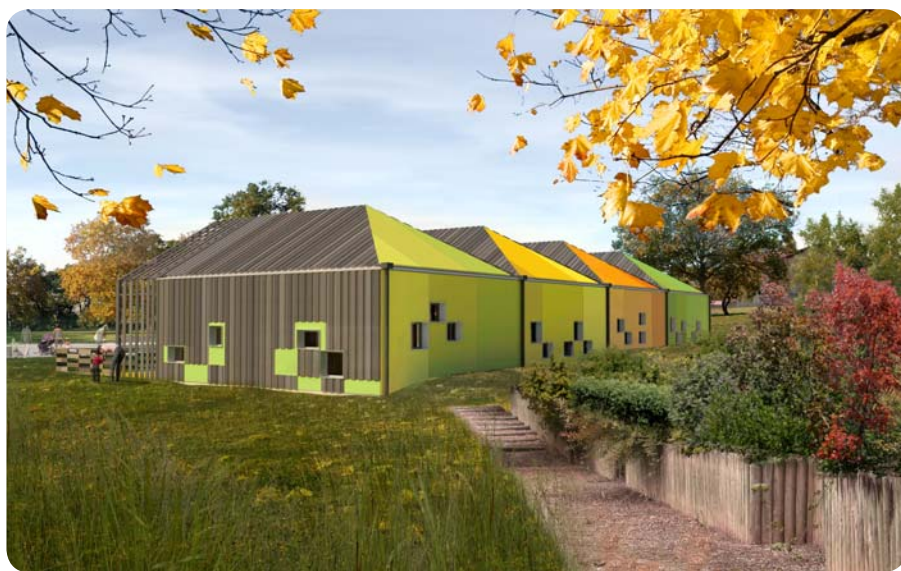
Ouverture prévue en janvier 2012.