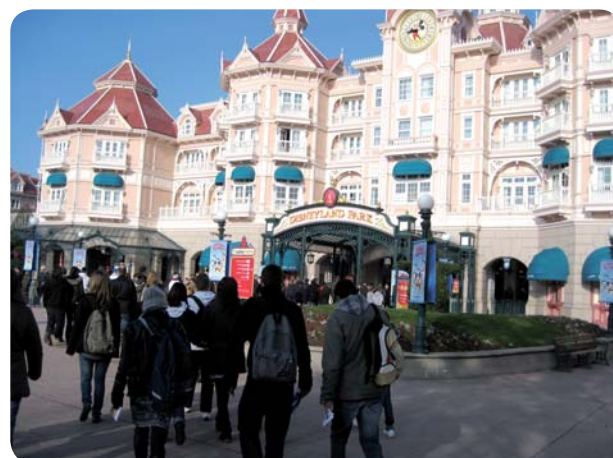
Entrons dans le monde merveilleux de Disney.