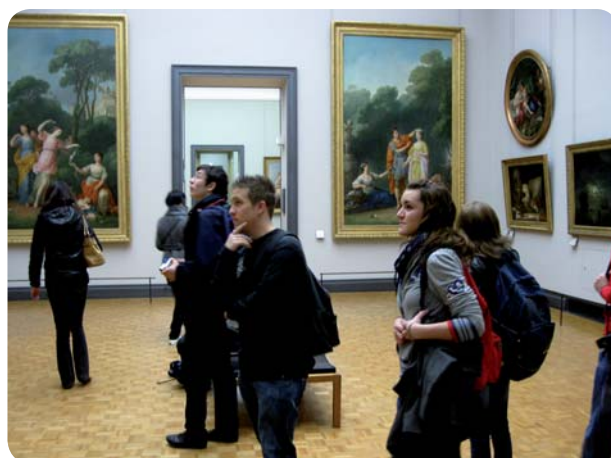
Au musée du Louvre, les œuvres d'art prennent une tout autre dimension que dans les livres.