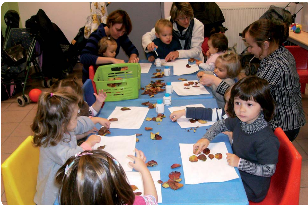
Assurer la socialisation dès 2 ans.

Le Point info famille y assurera une permanence.