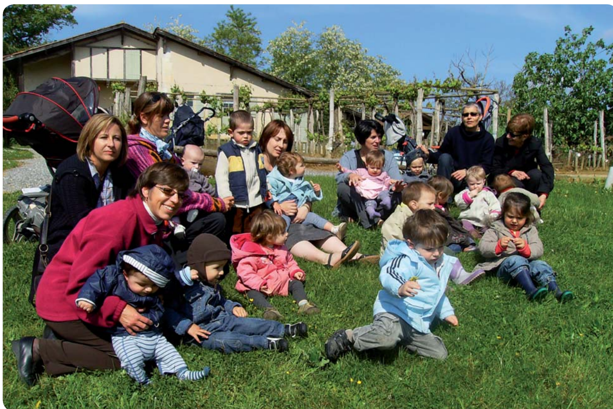
Sortie au Musée pour le groupe de Nousse.

Le Conseil général des Landes et le Conseil régional d'Aquitaine interviennent également dans le cadre de l'aide aux structures d'accueil de la petite enfance. L'Etat, au titre de la Dotation de développement rural (DDR), ainsi que le Fonds européen agricole pour le développement rural (FEADER) ont été également sollicités.