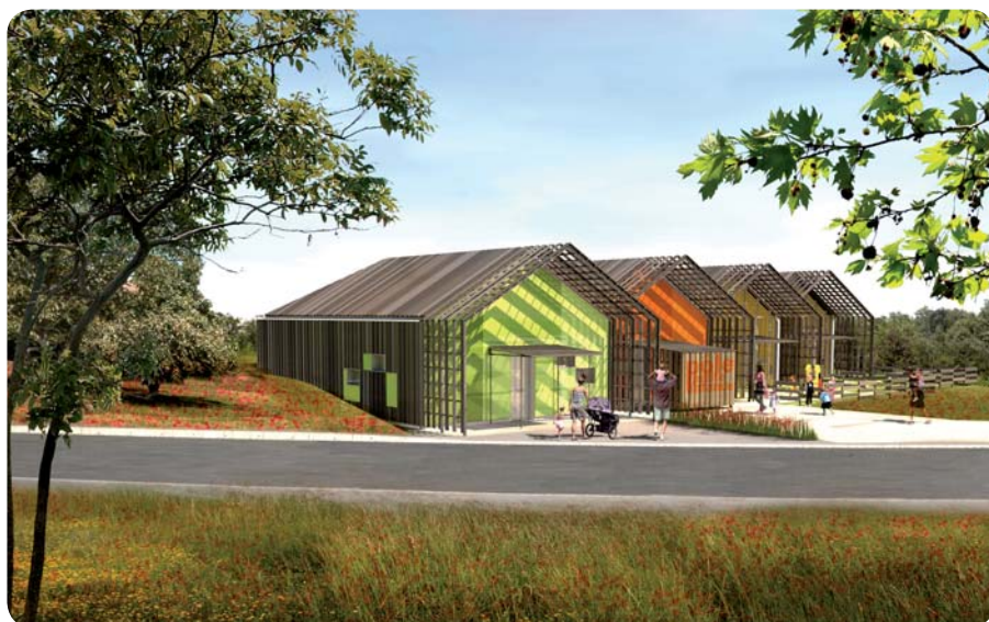
Dans cet écrin de nature, les façades déclinent les couleurs du site au fil des saisons.