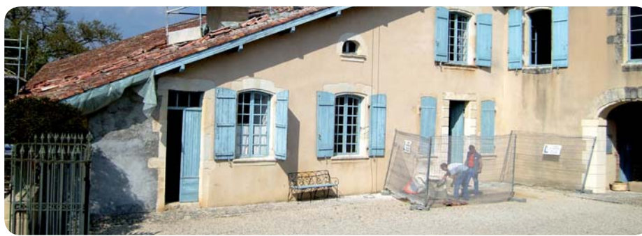
Des travaux pour améliorer les conditions d'accueil des visiteurs.

Plus largement, cette deuxième tranche de travaux dont le coût s'élève à 330 000 euros TTC, sont aussi l'occasion d'améliorer le confort des visiteurs, les conditions d'exposition et de conservation des collections. Ainsi, la rénovation de l'éclairage, l'installation de climatisation ou de chauffage, la pose de garde-corps et de mains courantes seront également réalisées. Au cours de ce chantier, le musée reste accessible au public. Cependant, quelques salles seront parfois fermées : nous comptons donc sur une bienveillante compréhension des visiteurs.