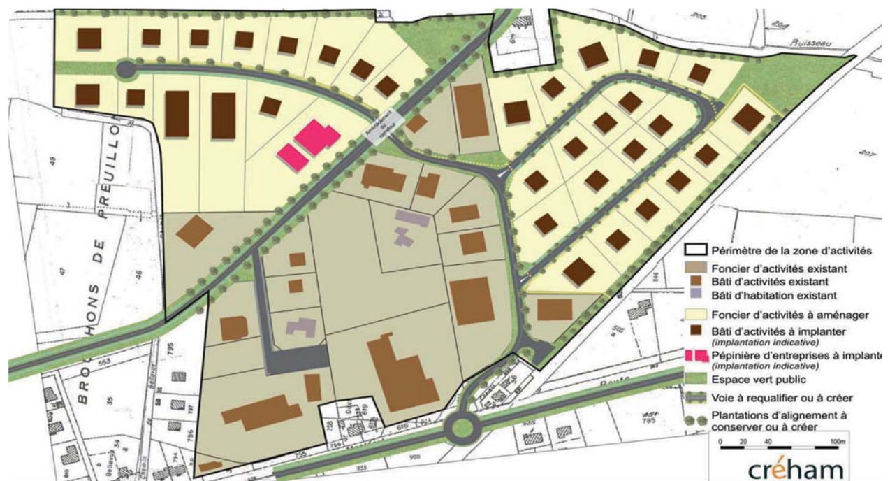
Schéma d'aménagement de la ZAE Intercommunale située à Hinx © Créham

Dès à présent, un lot (en rouge sur le plan) est réservé à l'implantation de la future pépinière d'entreprises destinée à accueillir des jeunes entrepreneurs en phase de démarrage. Dans un second temps, après la commercialisation des lots situés dans la partie Ouest, la partie Est de la zone d'activités d'une surface d'environ 4,5 hectares, pourra à son tour