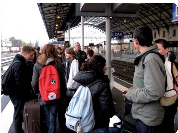
Attention au départ ! Après plus d'un an de préparatifs, c'est parti pour la grande aventure parisienne.

créer l'association « Paris Express » dans le cadre des Associations temporaires d'enfants citoyens (Atec). De la découverte de l'univers associatif, ils sont passés avec succès à la conception et à la gestion d'un projet, puis au développement de partenariats avec d'autres associations autour de leurs différentes initiatives destinées à financer le voyage. « Au départ, nous étions particulièrement motivés par le séjour et au fil de l'avancement du projet, la vie de l'association devenait beaucoup plus importante à nos yeux que le séjour lui-même. Aujourd'hui, la notion « être acteur de notre temps libre » n'a plus de secrets pour nous ».