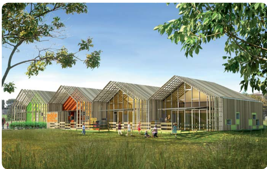
Un ensemble bien orienté et plus économique.