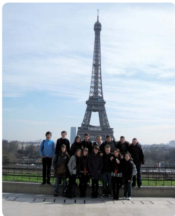
Nous en rêvions, nous y voilà. Du haut de ses 325 mètres, la tour Eiffel nous contemple