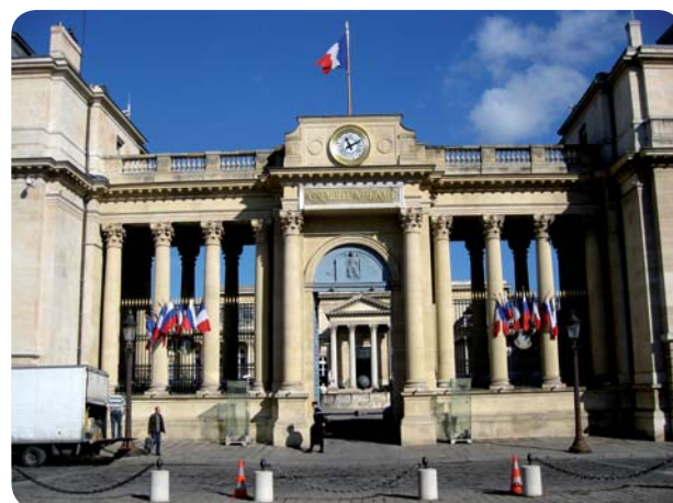
L'Assemblée nationale, l'un des hauts lieux de la République française, en plein cœur de Paris.