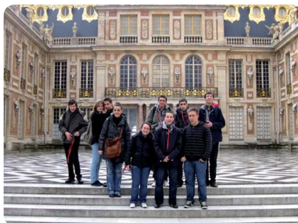
Le château de Versailles constitue incontestablement l'une des plus belles réalisations de Louis XIV.